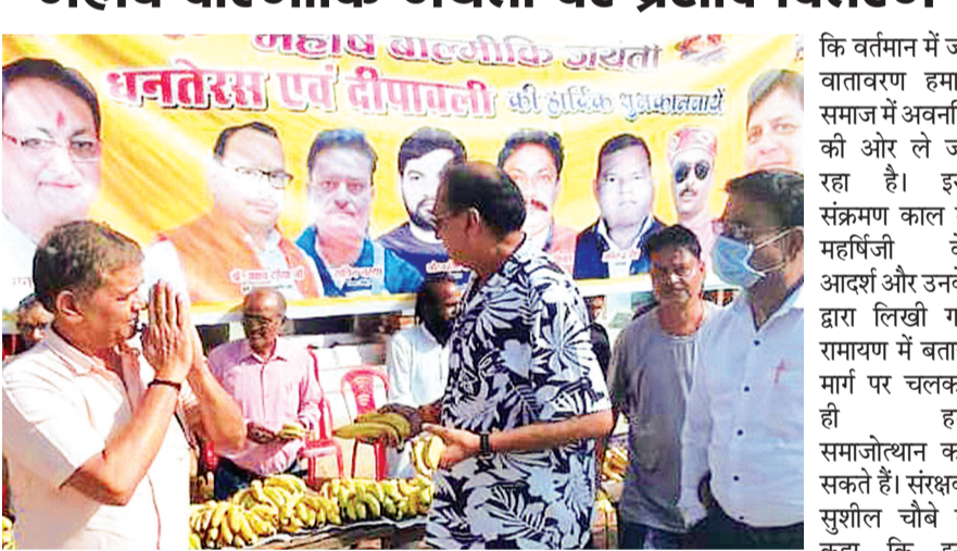
हरिभूमि न्यूज | ललितपुर

जिला फुटबॉल संघ के तत्वाधान में महर्षि बाल्मीकिजी की जयंती समारोह पूर्वक मनाई गई। इस अवसर पर स्थानीय जेल चौराहे पर